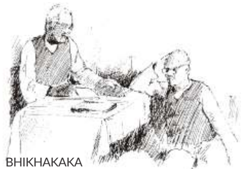
BHAIKAKA (CIRCA 1945)

Known as Bhaikaka and Bhikhakaka, they would use Education as an instrument for great rural change. They would set up an Educational Township for the people, of the people and by the people, as an enduring model for Free India.